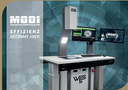
WES V5 - Wareneingangssystem